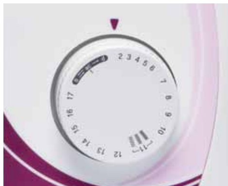
Einfache Stichauswahl mit Wahlknopf