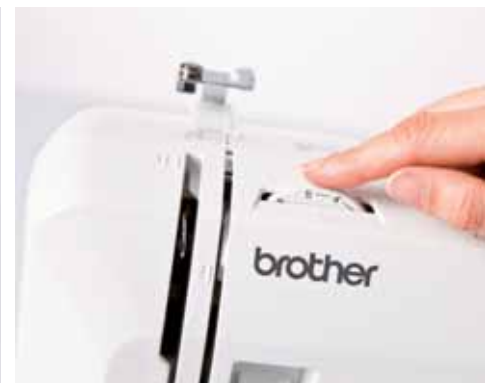
Einfaches Einstellen der Fadenspannung

Weitere Informationen erhalten Sie bei Ihrem Fachhändler oder unter www.brothersewing.eu .