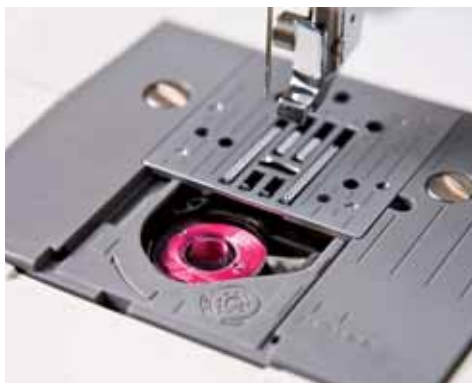
Komfortables Einsetzen der Spule